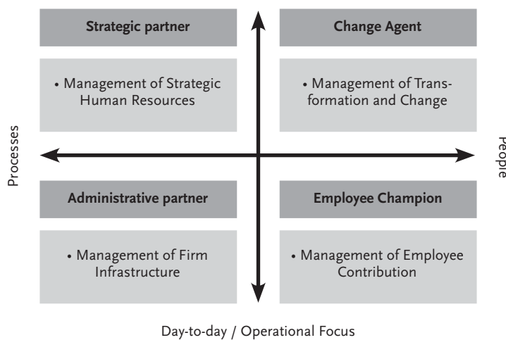
Figuur 1. Het rollenmodel van Ulrich.

managers who serve as employee champions creatively seek and implement the means for employees to voice opinions and feel ownership in the business; they help to maintain the psychological contract between the employee and the firm; and they give employees new tools with which to meet ever higher expectations.” Daarnaast geeft Ulrich aan dat HRM-professionals als employee champions ook een toegevoegde waarde hebben in het oplossen van conflicten tussen management en medewerkers en daarbij met name ook het belang van de medewerkers aan de orde kunnen stellen. Zie ook figuur 1.